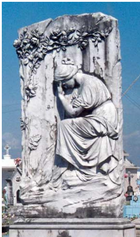
Foto 3 - Pranteadora - Manaus - AM