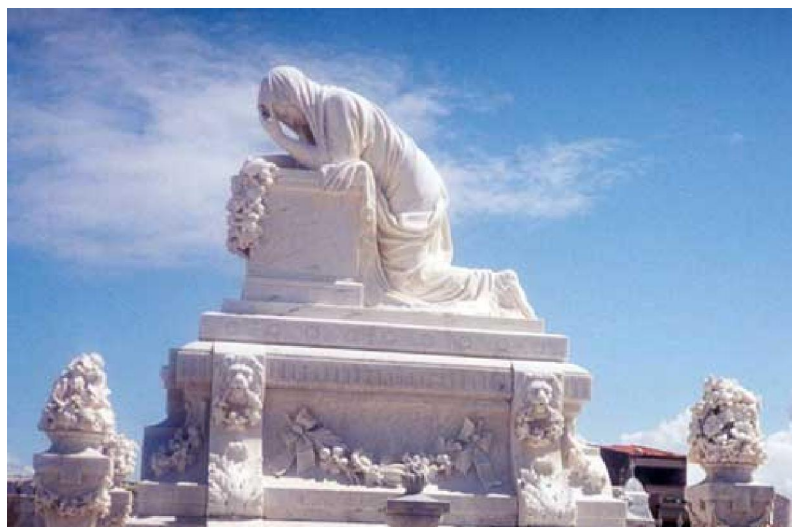
Foto 2 - Pranteadora - Maceió - AL