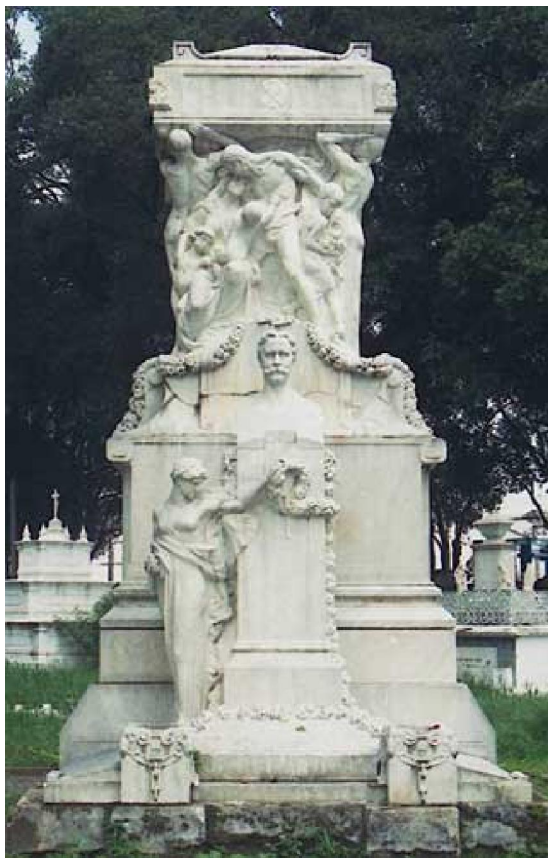
Foto 1 - Patriarca - Recife - PE.